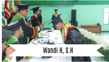
Wandu H, S.H